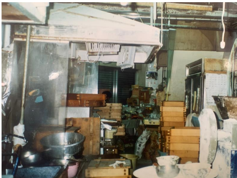
約40年前の旧工場の様子