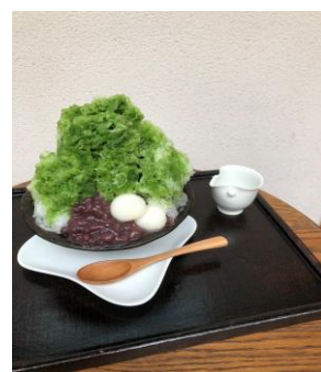
かき氷抹茶あずき