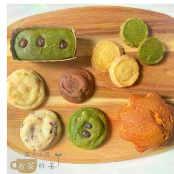
菓子工房『お茶の子』