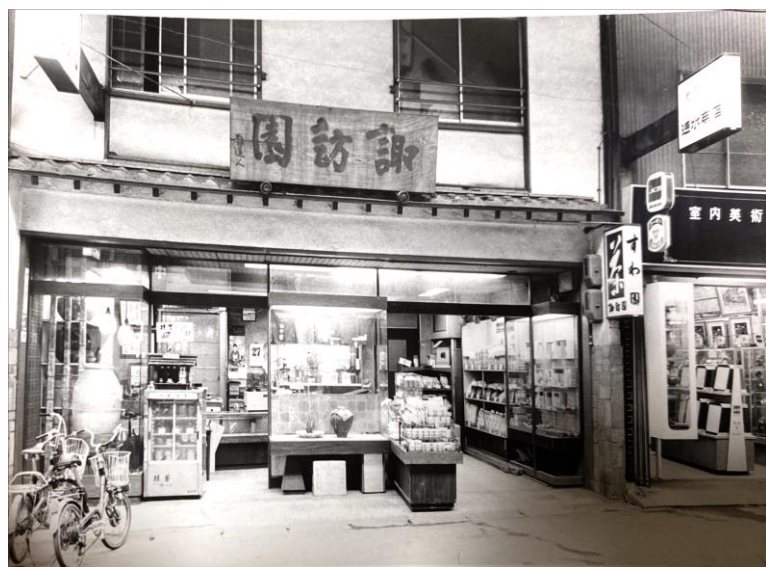
昭和48年頃の店舗風景