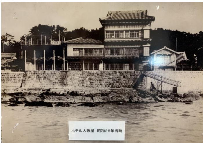
昭和25年 ホテル大阪屋風景