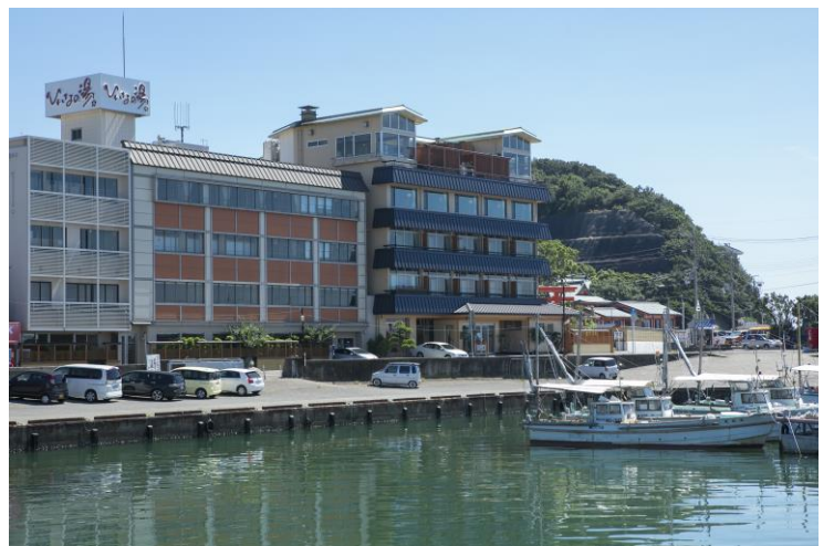
現在の大阪屋ひいなのお湯